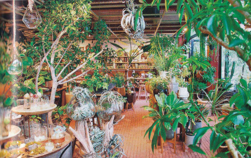
多種多様な植物にワクワク！シンボルツリーやインテリアにぴったりの緑が見つかりそう。

「GREEN'S (ガラスハウス)」は館内にあるセルフスタイルのカフェ。ポタニカルブレンド495円は、黒糖の香り。大阪・南森町の「OKASHI SEKAIYAN」のパウンドケーキ286円など。隣接の温室「テイクアウトOK」。